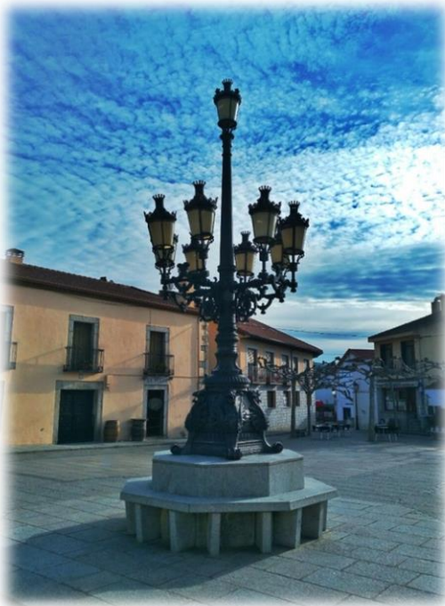
Luminaria en la Plaza de España. (Finales del XX)

En el siglo XII se produjo el asentamiento estable de Los Molinos, siendo sus pobladores ganaderos en su mayoría. Formó parte del territorio llamado El Real de Manzanares, hasta que, en el año 1667 la regente Mariana de Austria le concedió el título de villazgo.